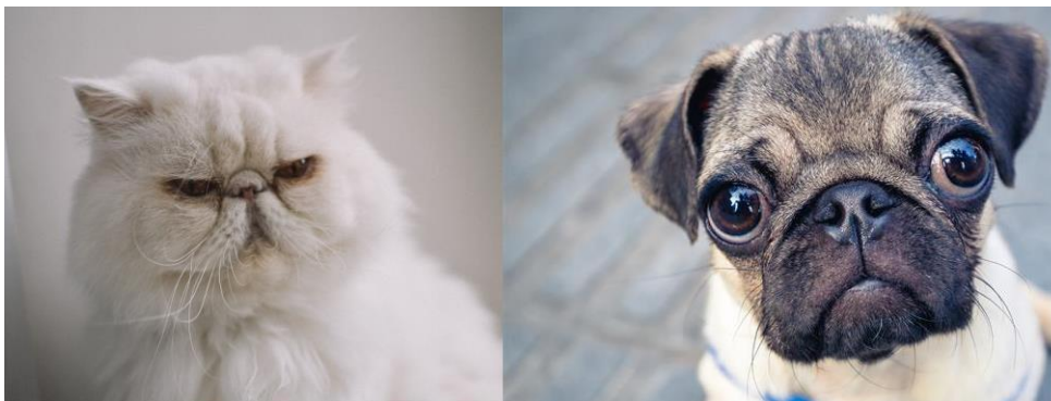
Exemplo de braquicefálicos: gato Persa e cachorro Pug.